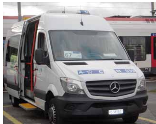
Le bus de la ligne tl 67.

ser le tracé de la ligne tl 67, doit aussi proposer une solution pour desservir Grandvaux et Aran à l'horizon 2017. Les résultats de cette étude sont attendus pour ce printemps. D'autres projets sont à l'étude dans le cadre du Plan Directeur de la Mobilité Communale (PDCM), à savoir :